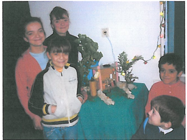
FORMAZIONE GIOVENTU' DI BATHORE- ALBANIA