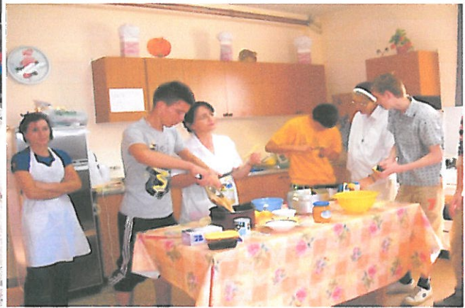
TEMPI DI FORMAZIONE-CATECHESI- ORATORIO BATHORE-ALBANIA