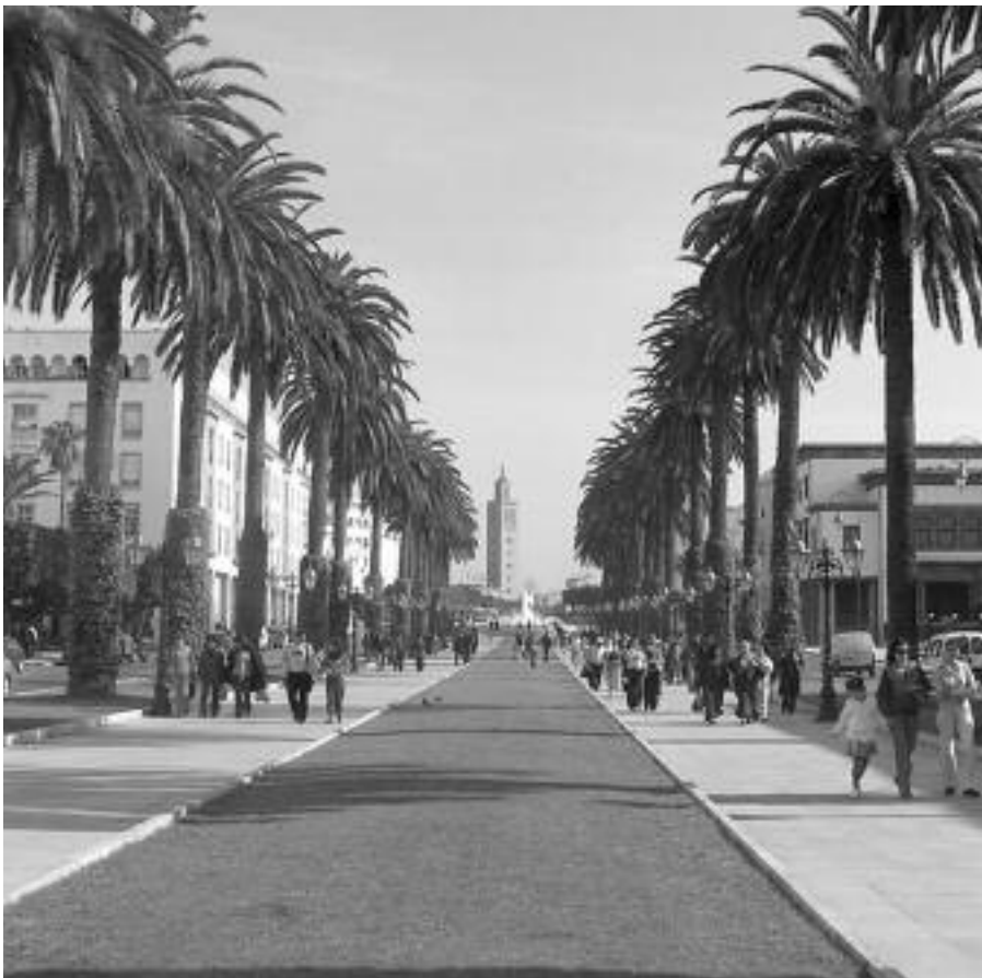
Il viale del Parlamento a Rabat.

Dopo l'11 settembre 2001 e il consolidamento della cooperazione tra Marocco e USA sul piano dell'antiterrorismo, il GICM avrebbe deciso l'azione del 16 maggio 2003 per punire quest'alleanza. L'intelligence marocchina afferma che gli attentati di Casablanca e di Madrid sono stati pianificati e coordinati da al-Qaida ma eseguiti dal GICM . I legami con al-Qaida sono stretti. Il GICM ha la dimensione di un gruppo terrorista internazionale, sostenuto da al-Qaida per i suoi interessi strategici nell'area del Maghreb. Gli attentatori di Casablanca provengono dalle bidonvilles mentre i