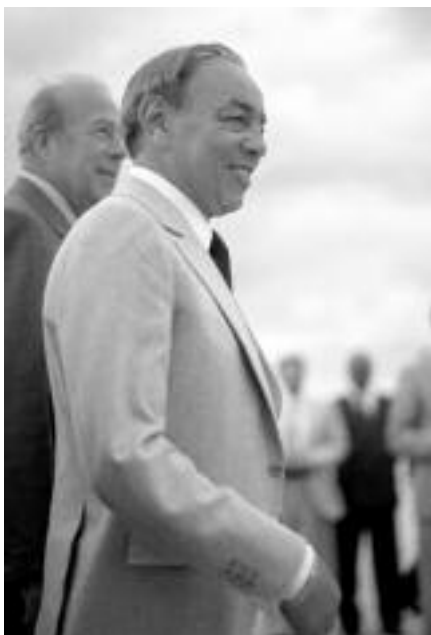
Hassan II regnò dal 1961 al 1999.

Quali fossero i motivi di contestazione politica del sultano non sono chiari. Probabilmente riguardavano la mancata osservanza del patto di alleanza, la mancanza ai doveri essenziali, la cui tradizione potrebbe essere confluita nell' art. 19 della Costituzione marocchina . 4 Esso afferma che il re, Amīr al-mu minīn ("comandante dei credenti"), vigila al rispetto dell'islām, dei suoi costumi e della sua morale. Pertanto deve combattere la corruzione, la depravazione, la tiepidezza o l'indifferenza re-