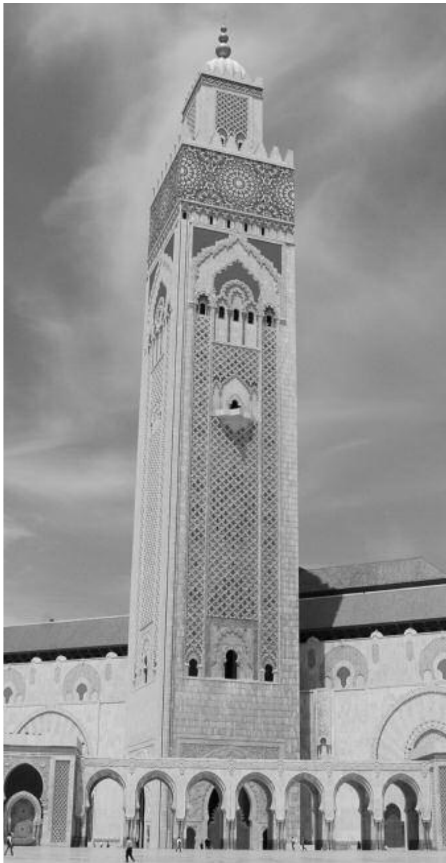
La moschea di Casablanca.

taggi arridevano sostanzialmente ad una quarantina di grandi famiglie.