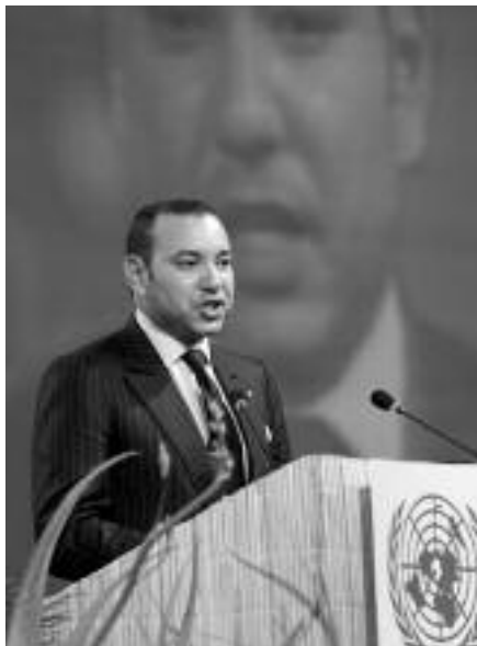
L'attuale Re del Marocco Mohammed VI. In alto: il Palazzo Reale di Rabat.

Per comprendere l'attualità e illuminare aspetti tradizionali che giocano ancora un forte ruolo nell'orientare i processi politici e religiosi, ripercorriamo per sommi capi alcuni capitoli della storia antica del Marocco e soprattutto del protettorato.