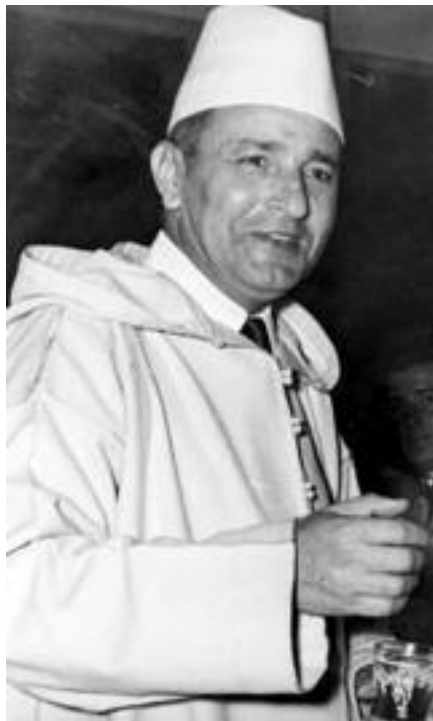
Mohammed V, il Re dell'indipendenza, sul trono dal 1956 al 1961.

La Residenza approfittò della debolezza di Moulay ben Arafa per spogliarlo delle prerogative legislative e governative. D'altro canto, esiliando Mohammed V ne fece un martire agli occhi del popolo e contribuì a creare la leggenda di "Sidna" (il nostro Signore) e un attaccamento mistico al sovrano. Tutti, arabi e berberi, conservavano e veneravano nelle case il suo ritratto. Le moschee il venerdì si svuotavano quando